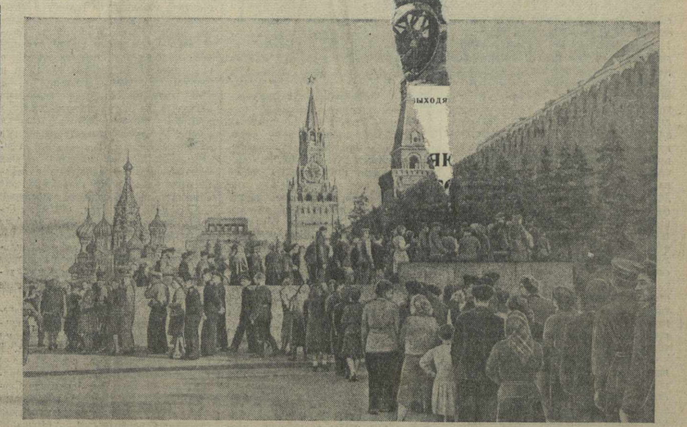
В Москве на Красной площади, Москвичи пришли к могиле М. И. Калинина почтить память одного из основателей и выдающихся руководителей большевистской партии и советского государства.

В тех случаях, когда дело вторично поступает в кассационную инстанцию и выявляется необходимость вторично отменить решение суда первой инстанции, вышестоящий суд, отменяя решение, не должен передавать дело на новое рассмотрение в нижестоящий суд, а обязан сам рассмотреть это дело по первой инстанции. (ТАСС).