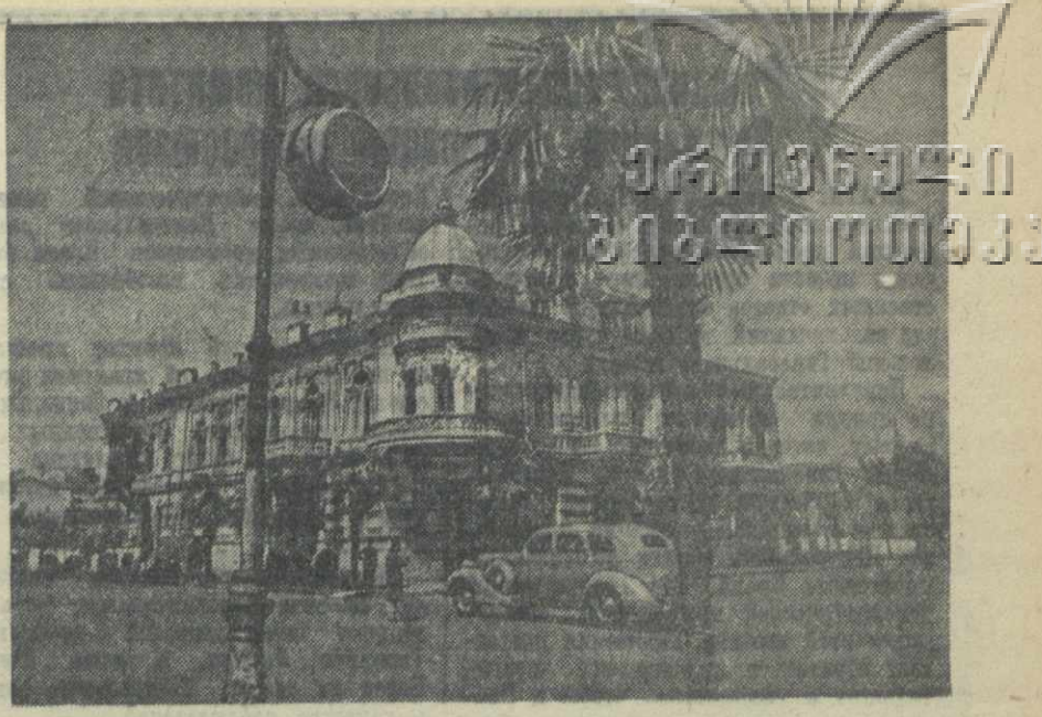
Батуми, На улице имени Сталина.