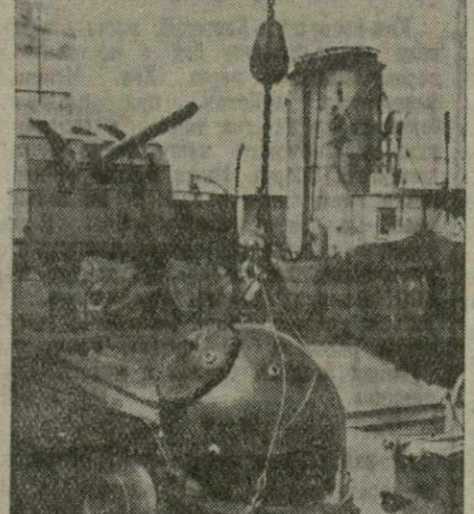
Военно-морской флот Англи. На снимке: погрузка мины на минный заградитель.

ЛОНДОН, 25 августа. (ТАСС). По сообщению агентства Рейтер, вчера в Риме было казнено 15 словенских солдат, участвовавших в партизанской борьбе против итальянцев в Югославии.