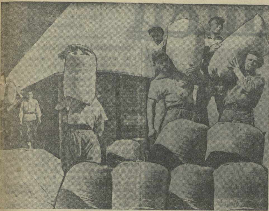
6 июля Цирковая база «Заготзерно» отгрузила Потийскому мельничному комбинату 20 вагонов пшеницы нового урожая.