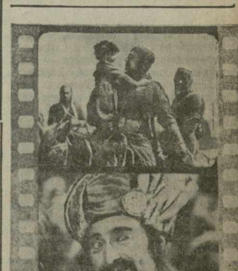
Кадр из фильма «Георгий Саакадзе» (нар. артист СССР А. Хорва) со своими воинами.

В работе над образом Русудан мне хотелось обобщить лучшие черты грузинских женщин — тех, что ныне благословляют своих сынов на победную битву с немецкими захватчиками.