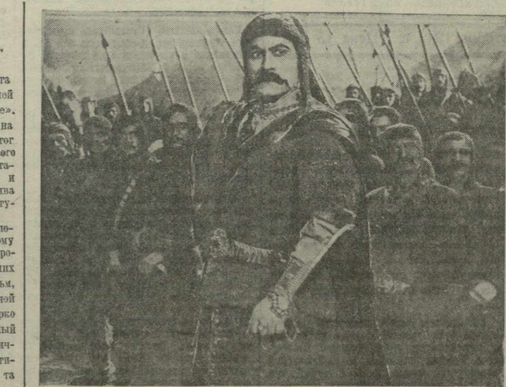
Кадр из фильма «Георгий Саакадзе» (нар. артист СССР А. Хорва) со своими воинами.

В театрах Тбилиси. 8 сентября — 8 сент. «Ритмолет», 9 сент. «Фантом», 10 сент. «Дура для других».