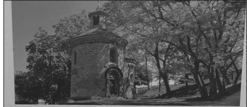
ჩემი სამშობლო ცვლილების გზით სახლის ისტორიები

გამოფენა ყოველწლიურად იწყება პრაღაში გახსნით. გამოფენის მონაწილეები, საჯარო და კერძო პირები უფასოდ ესწრებიან გამოფენას, რომელიც მოძრავია. გამოფენის ნახვა შეგი-