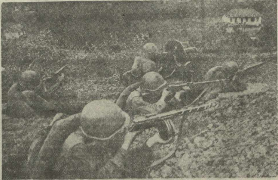
Северный Кавказ. На снимке: бойцы ведут бой за населенный пункт.

НЬЮ-Йорк, 27 октября. (ТАСС). Уилки выступил по радио с речью об итогах своей поездки на Ближний Восток в СССР и Китай.