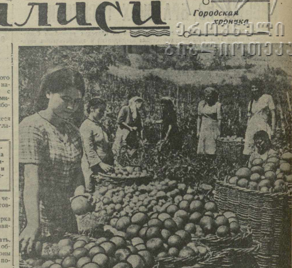
Ежедневно в Тбилиси поступает большое количество овощей из Тетрикарского колхоза. На снимке: подготовка к отправке в Тбилиси собранных помидоров в колхозе имени Берия, селения Асурети.

ТРЕБУЮТСЯ кассир-счетовод, статистик, рабочий по приему и выдаче кинофильмов, грузчик и старший бухгалтер. Снабжение через ОРС. За справками обращаться к главному бухгалтеру с 11 ч. утра до 5 ч. вечера, по адресу: Плехановский пр., 164.