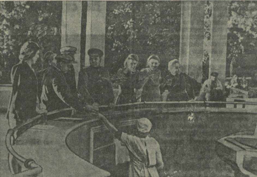
Боржом-парк. У источника.

По телефону и телеграфу от наших корреспондентов