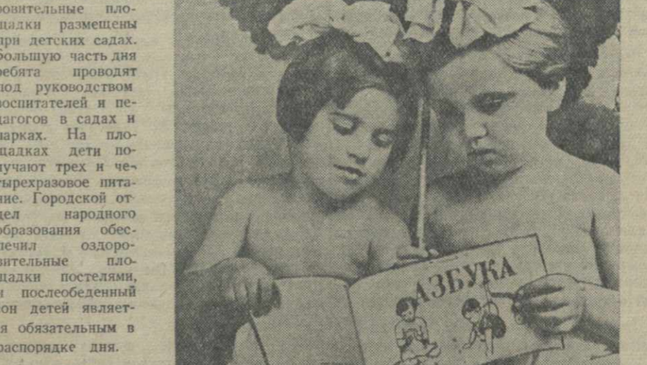
На снимке — питомцы оздоровительной площадки Сталинского района.

Тысячи детей дошкольного возраста отдыхают на детских оздоровительных площадках, организованных летом этого года во всех районах Тбилиси.