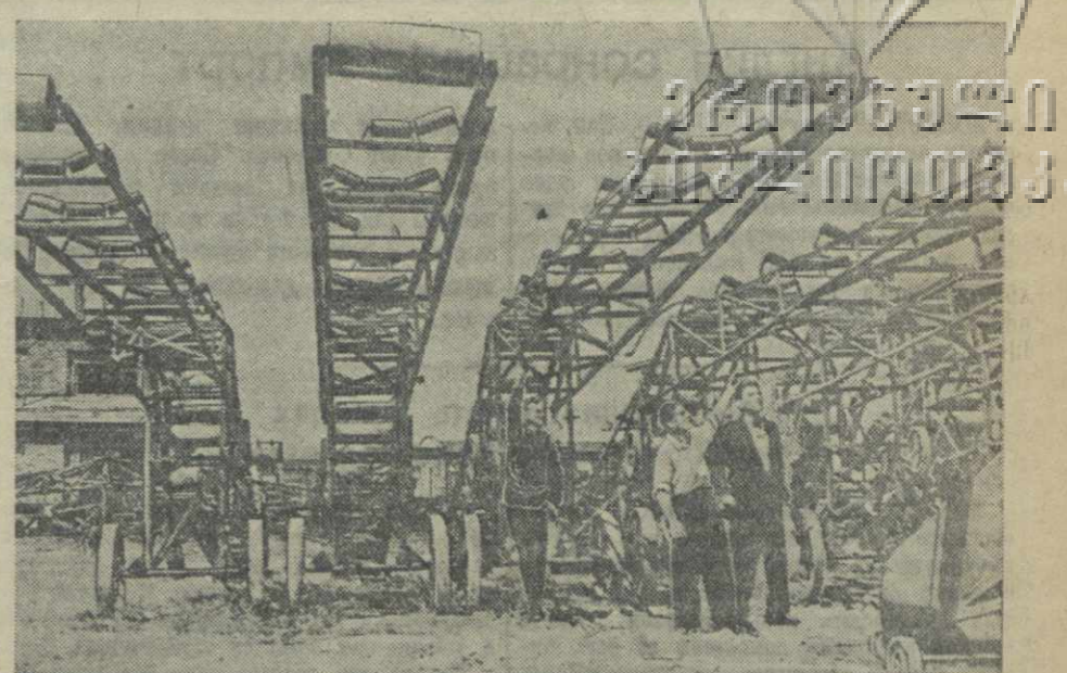
Кутаисский машиностроительный завод успешно осваивает выпуск различных видов оборудования для угольной промышленности. На снимке: один из видов заводской продукции — транспортеры «Ленинец».

В предстоящем учебном году в школы Абхазии придут новые педагогические кадры — 260 молодых учителей, окончивших в этом году педагогические институты.