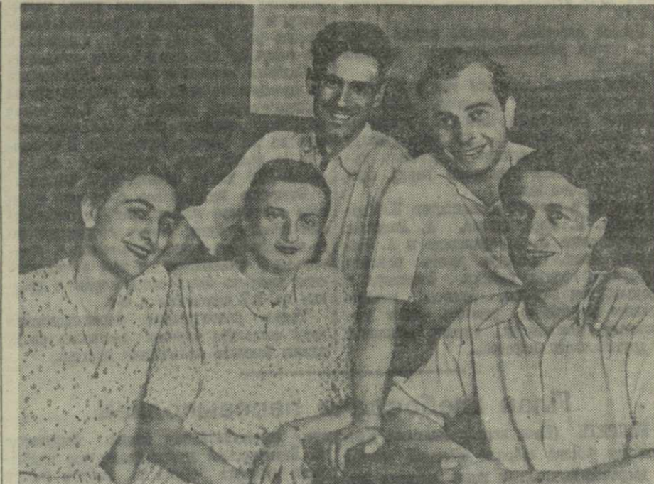
В Тбилиси возвратилась из Праги группа молодых представителей искусства Грузии, принимавшая участие в Международном фестивале молодежи в составе делегации Советского Союза.