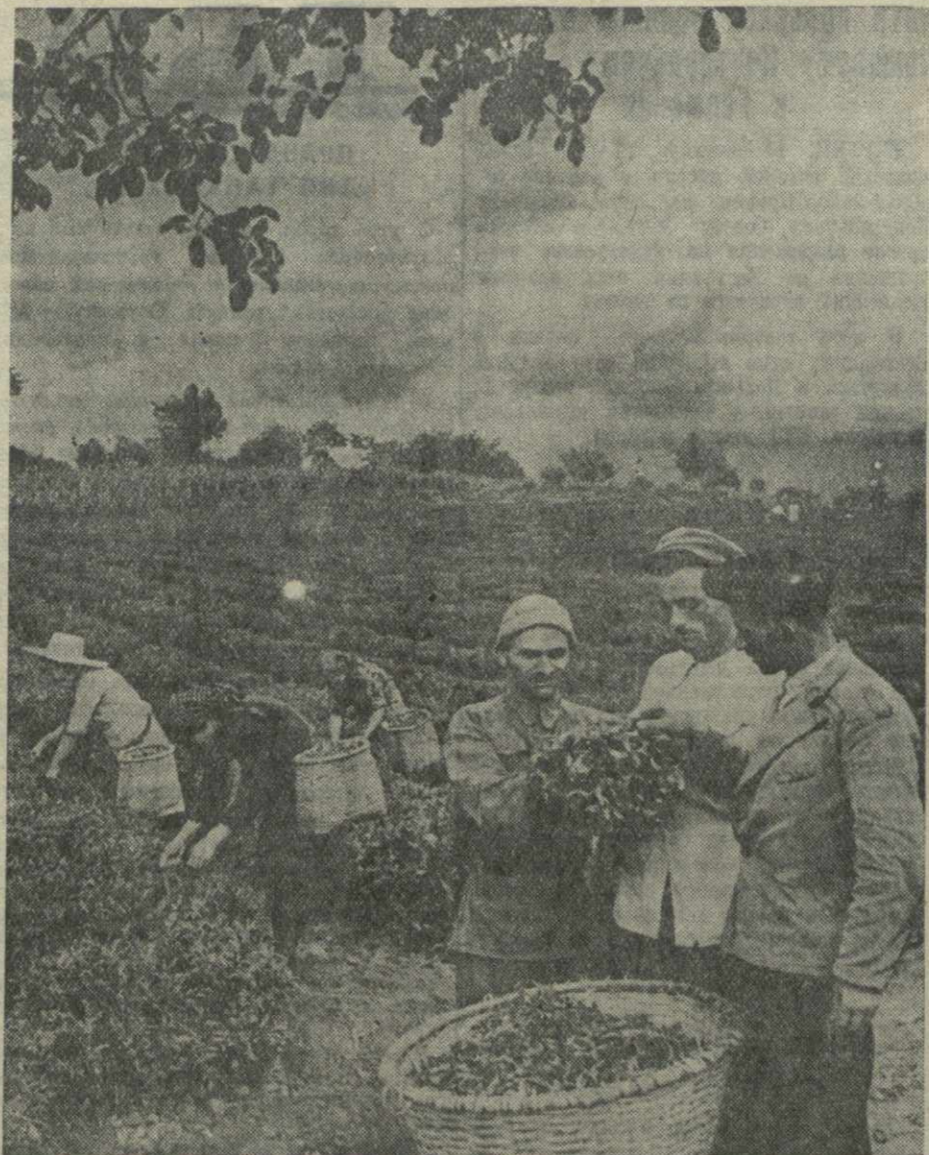
Сбор чайного листа в колхозе имени Берия селения Ахали-Сопели Зугдидского района.