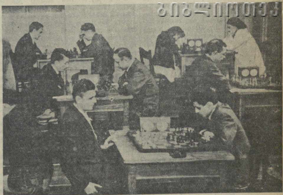
Шахматный матч трех республик. На снимке: встреча между шахматными командами Грузии и Азербайджана.

Посетителям вечера были показаны кинофильмы. В саду клуба состоялся концерт.