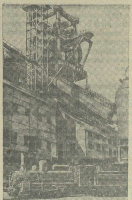
Доменная печь № 3 завода «Запорожсталь».

Советские строители блестяще справились с этой задачей. Точно в сроки, установленные правительством, один за другим были введены в действие в этом году цехи возрожденной «Запорожстали». Доменная печь и теплоэлектростанция — в июле, прокатный стан — слэбинг — в июле, цех прокатки тонкого листа — в августе, цех холодного проката — в сентябре. Советская строительная индустрия при-