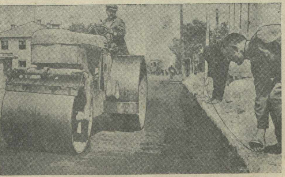
На улице Борьбы идут работы по асфальтированию проезжей части. На снимке: каток за работой.

В годы сталинских пятилеток район Дидубе обогатился промышленными предприятиями, благоустроенными жилыми домами. В новой пятилетке здесь будет создан большой промышленный район, который протянется от ипподрома до сукопной фабрики. На территории этого нового района будут построены крупные предприятия: кондитерский и молочный комбинаты, парфюмерная фабрика, хлебозавод, трамвайно-вагоноремонтный завод и другие.