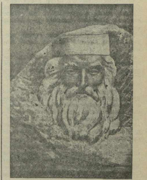
Портрет Саба-Сулхана Орбелиани. Работа засл. деятеля искусств скульптора С. Какабадзе.

Среди скульптурных работ — бюст «Ленин» — создатель «Искры» — действительного члена Академии художеств СССР народного художника Грузии Я. Николадзе, «Саба-Сулхан Орбелиани» и бюст поэта Галактиона Табидзе — засл. деятеля искусств С. Какабадзе, барельеф «Оборона Кавказа» — Т. Абакелия, бюст маршала