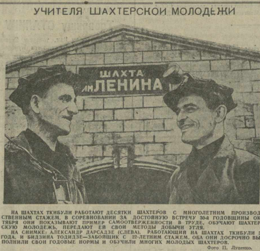
НА ШАХТАХ ТКИБУЛИ РАБОТАЮТ ДЕСЯТКИ ШАХТЕРОВ С МНОГОЛЕТНИМ ПРОИЗВОДСТВЕННЫМ СТАЖЕМ. В СОРЕВНОВАНИИ ЗА ДОСТОЙНУЮ ВСТРЕЧУ 30-й ГОДОВЩИНЫ ОКТЯБРЯ ОНИ ПОКАЗЫВАЮТ ПРИМЕР САМОУВЕРЕННОСТИ И ТРУДА. ОБУЧАЮТ ШАХТЕРСКУЮ МОЛОДЕЖЬ, ПЕРЕДАЮТ ЕЕ СВОИ МЕТОДЫ ДОБЫЧИ УГЛЯ.