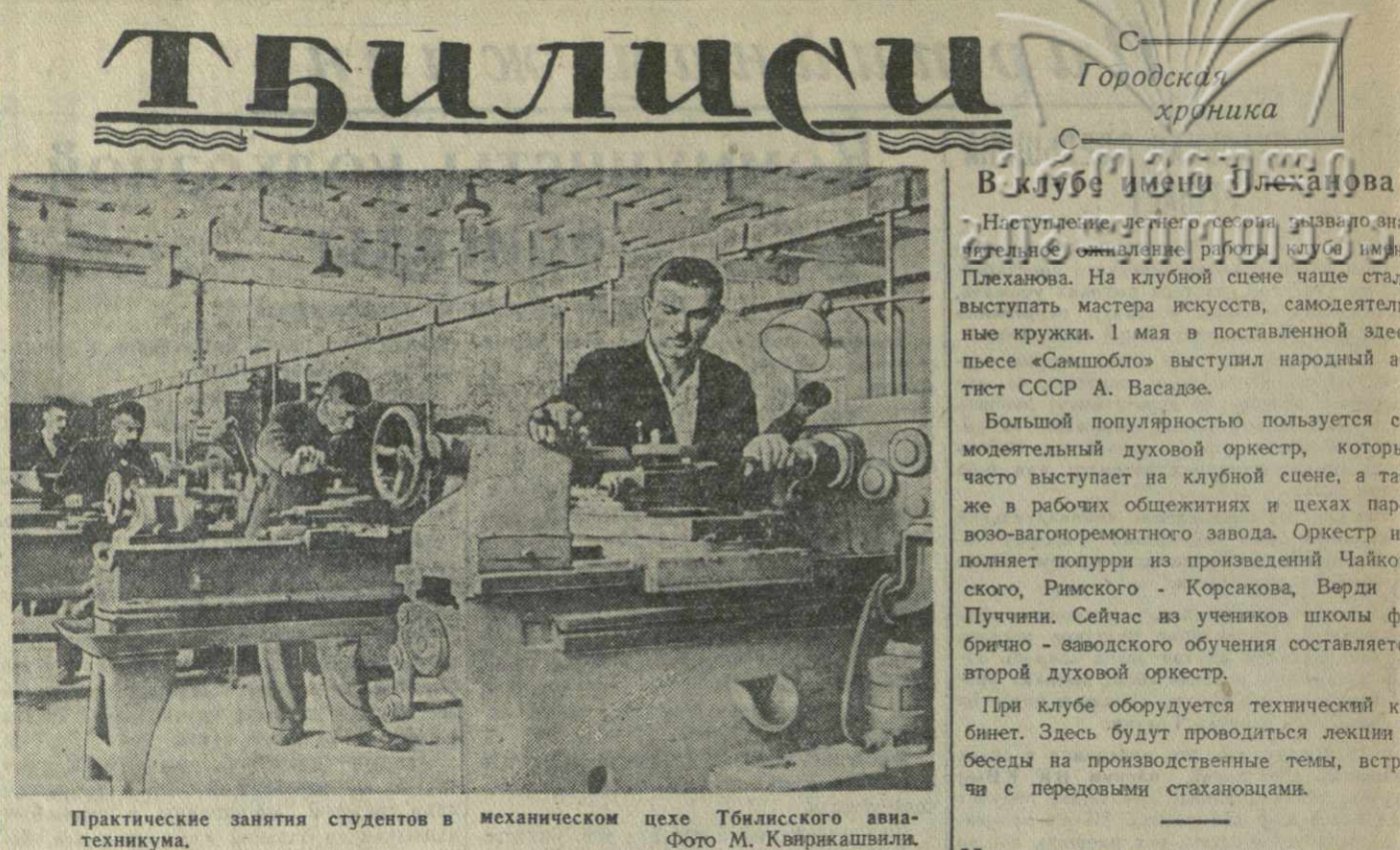
Практические занятия студентов в механическом цехе Тбилисского авиатехникума.

По сообщению лондонского радио, консервативные члены парламента предложили сократить размер английских газет до 2 страниц в связи с недостатком газетной бумаги. Турецкими властями вынесено постановление о привлечении трех преподавателей Анкарского университета к ответственности «за пропаганду крайне левых идей». (ТАСС).