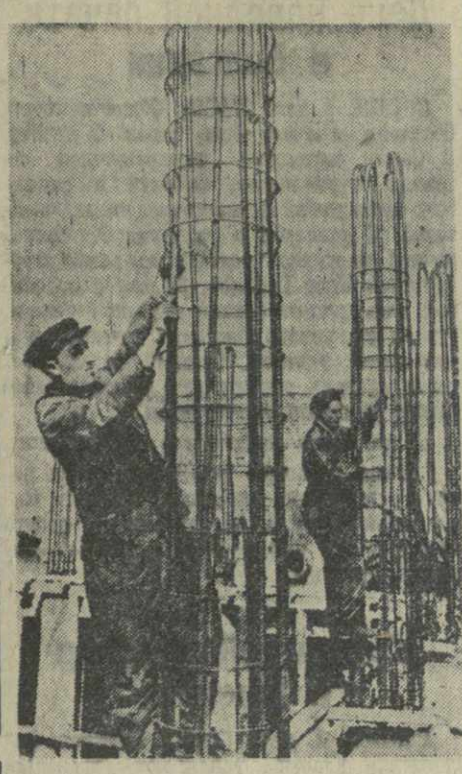
На стройке Дворца правительства Грузинской ССР.

Производственные опыты наглядно показывают также высокую эффективность химической мелиорации почв путем известкования. Как видно из цифровых данных, насть по эффективности не уступает навозу и еще больше повышает урожай цитрусовых при совместном внесении в почву с навозом.