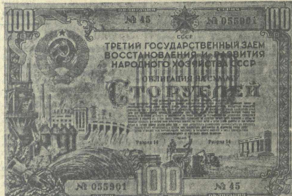
Облигация Третьего Государственного Займа Восстановления и Развития Народного Хозяйства СССР достоинством 100 рублей.

Большинство рабочих и служащих подписались на 5—6-недельный заработок. Подписка продолжается.