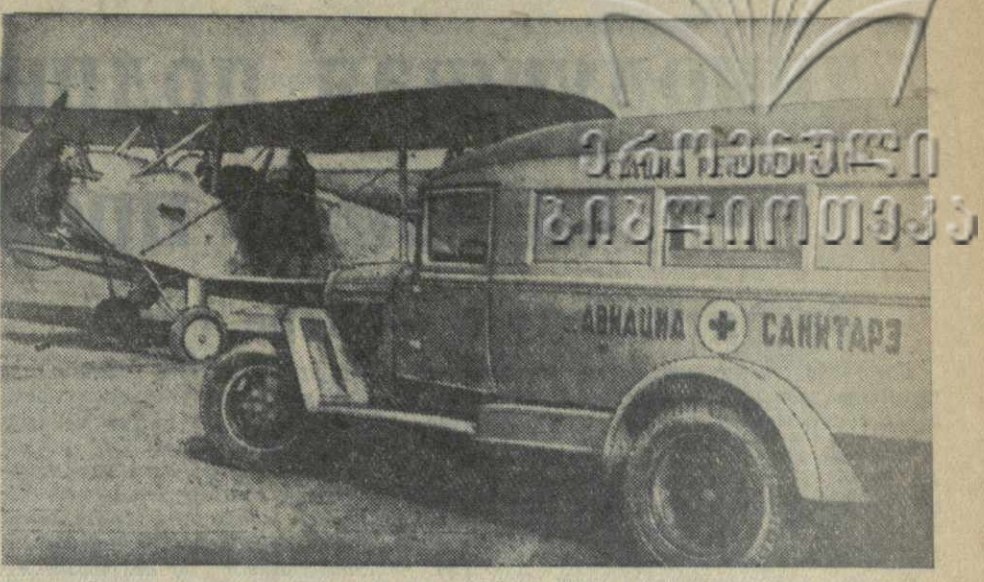
Отдаленные районы Молдавской ССР связаны со столицей республики — Кишиневом авиационными и пассажирскими линиями. В состав местного отряда Гражданского воздушного флота входят звенья сельскохозяйственной и санитарной авиации.

Передовые рабочие совхоза приняли новые обязательства по повышению урожайности. Они соревнуются за получение 1.000 цитрусовых плодов с каждого из 6.000 плодовых деревьев.