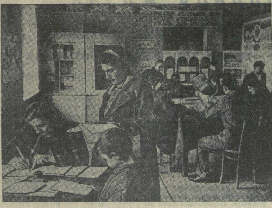
В читальном зале Дома культуры в Кварели.

14 мая в конференц-зале Академии наук Грузинской ССР состоялось собрание, посвященное 500-летию со дня рождения великого поэта узбекского народа Алишера Навои.