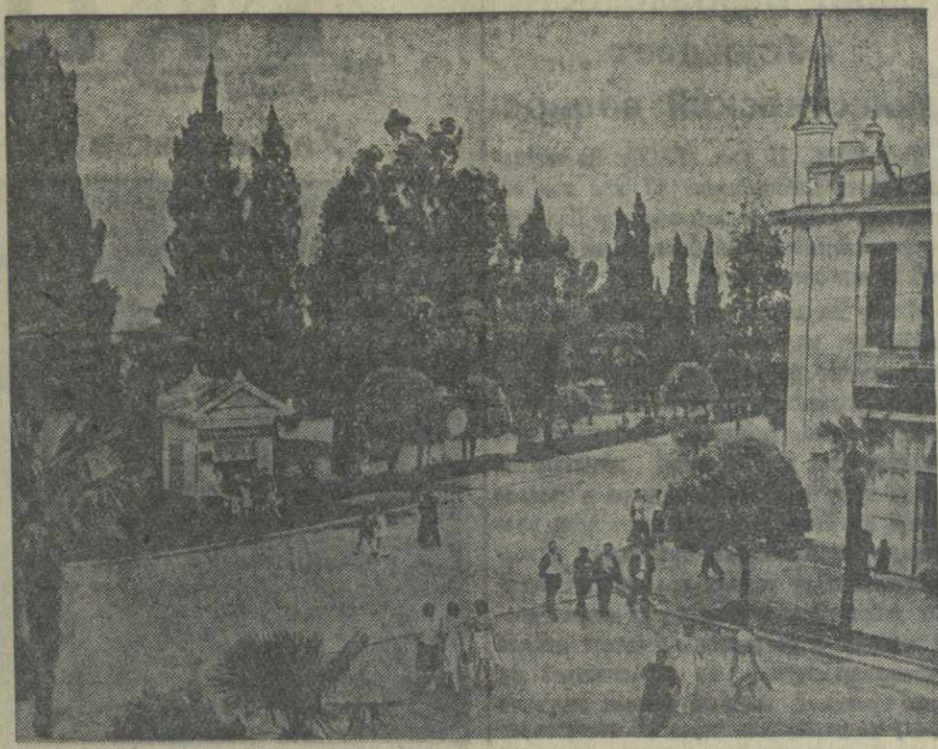
Сухума. Угол ул. Ленина и проспекта Руставели.