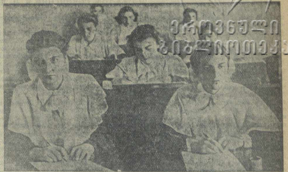
Вчера в школах Грузии был большой день. Начались переводные и выпускные экзамены.

Особенно торжественное настроение было у четвереклассников. Они впервые в жизни держали экзамены. Наравне с восьмиклассниками и одиннадцатиклассниками они называются сейчас выпускниками. Это — важная веха на их жизненном пути.