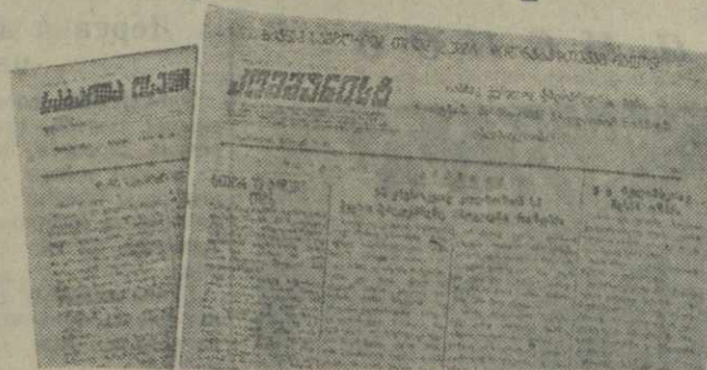
Специальные выпуски газет «Сабчота Осети» и «Коммунист» на строительстве Самгорской оросительной системы.

Блеская дорога Горы — Сталинири, шоссе Гурфа — Часовали — Гурфа, Бехевский оросительный канал, дороги, соединяющие Сталинири с отдаленными горными селениями, — много труда вложили колхозники Юго-Осетии во все эти стройки, справедливо названные народными. На земляные работы выданы десятки тысяч людей, они вынули миллионы кубометров земли, выполнили большой объем бетонных работ.