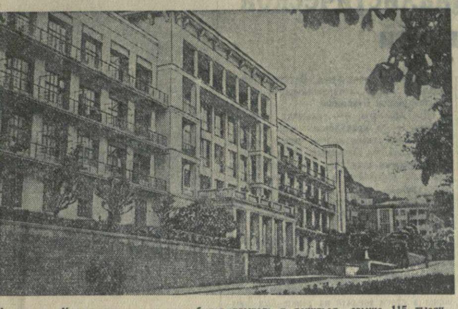
На курорте Кисловодск в этом году будет отдыхать и лечиться свыше 115 тысяч трудящихся. Уже работает более 40 санаториев. На снимке: санаторий имени Кирова в Кисловодске.

РОСТОВ-НА-ДОНУ, 18 июня. (ТАСС). В прошлом году в районе села Мокрая Кагадовка на участке 1,4 гектара опытной плантации хозяйства Новочеркасского торгпредства посеяли семена сахарного тростника.