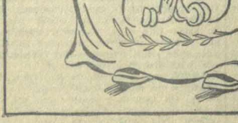
Рис. худ. И. Гурро. Текст Н. Нарзиани.

Скажи мне, ветка Палестины, как ты у Бейна цвела? И слышен голос из пустыни: — Об этом знает Абдулла!