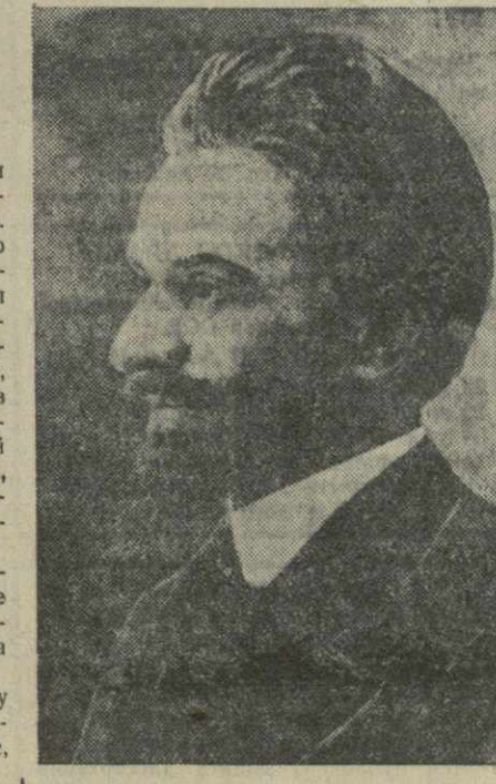
возглавил там большевистскую организацию. Он был избран председателем городского комитета партии и членом президиума Владикавказского Совета рабочих и солдатских депутатов.