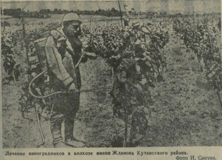
Лечение виноградников в колхозе имени Жданова Кутанского района.

Во всех парках и скверах сделаны новые ограды, высажены декоративные насаждения. Проводятся работы по очистке канав и устройству пешеходных мостов.