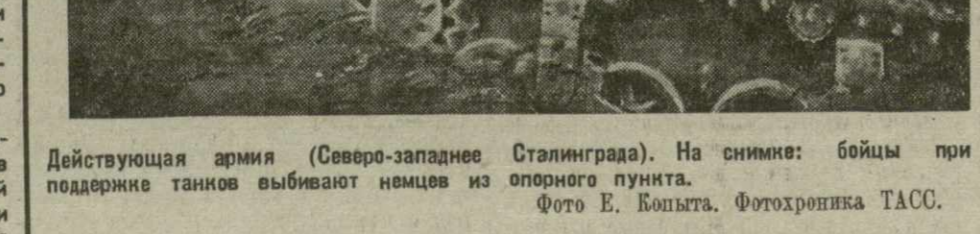
Действующая армия (Северо-западнее Сталинграда). На снимке: бойцы при поддержке танков выбивают немцев из опорного пункта.