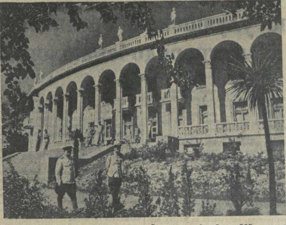
Центральный санаторий Вооруженных Сил Союза ССР, построенный в 1946 году.

СУХУМИ. (Наш корр.). На курортах Абхазии летний сезон в разгаре. В Гагра, Сухуми, Ахали-Афонии, Гулаута ежедневно прибывает большое число курортников. Открыто 39 санаториев и домов отдыха. Особенно много курортников в Гагра. Здесь работает более 20 здравниц. В селении Деселидзе, расположенном в 20 километрах от Гагра, открыты санаторий имени Баумана и спортивная база общества «Динамо». В Сухуми принимают больных и отдыхающих санаторий «Гангиади», дома отдыха для моряков Северного флота и офицеров Закавказского Военного округа и клинический санаторий, в котором при лечении желудочно-кишечных заболеваний успешно применяется аваджарская минеральная вода. В Ахали-Афонии открылись санатории «Абхазия» и «Приморский». В Гулаута в двух санаториях «Волга» и «Скорход» отдыхают и лечатся работники различных промышленных предприятий. На курортах открыты морские и лесные пляжи. В Гагра и Ахали-Афонии работают водолечебницы и поликлиники. В нынешнем сезоне впервые после войны открылся санаторий № 3 (в Ахали-Афонии) на 510 коек и санаторий «Колхида» (в Гагра) на 100 коек.