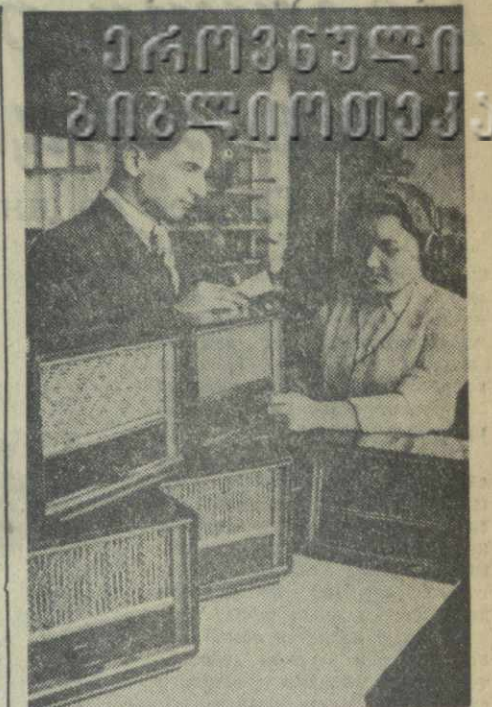
На Минском радиозаводе имени Молотова освоено производство новых детекторных радиоприемников. Первые сотни таких приемников направлены в колхозы республики.

В результате плохой организации труда, низкой трудовой дисциплины уборка затягивается. Колхоз имени Андреева селения Зикияли в течение 4 дней убрал всего 19 гектаров.