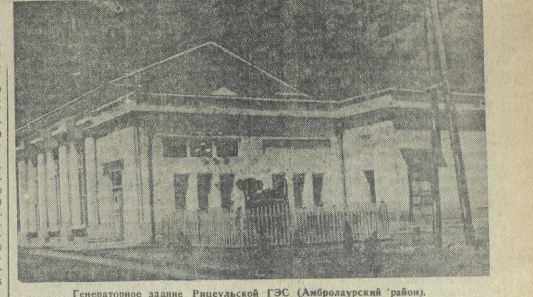
Генераторное здание Рицеульской ГЭС (Амбролаурский район).

Причины нынешнего отставания сельской электрификации Грузии были в центре внимания участкового совещания. Эту причину немало докладчик признал наличие серьезных недостатков в работе треста «Грузсельэлектро»: отсутствие оперативно — сметной документации, недостаточное техническое руководство отдельными важными участками, неудовлетворительное использование имеющихся материальных ресурсов. Но причины отставания в большей степени кроются и в том, что районные партийные и советские организации, а также шефы — крупные предприятия и стройки республики — плохо помогают тресту, недооценивают значение хозяйственно — политического значения сельской электрификации. Недостаточно включилось в это дело и Министерство сельского хозяйства Грузинской ССР. Три года строится в Сагареджском районе Патардзевульская ГЭС. Прогаб этого строительства тов. В. Ледуашвили рассказал совещанию, в каких трудных условиях приходится здесь работать. За последние два месяца колхоз им. Кирова выдал стройке только 40 человек — по