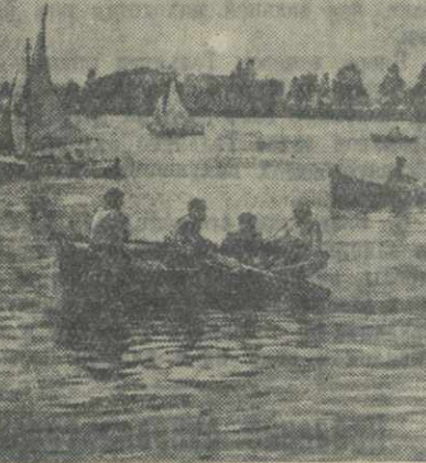
Батуми. На озере в пионерском парке им. Берия.

Сейчас у нас начались отделочные работы. И здесь мы думаем добиться большой экономии таких материалов, как олина, краски и т. п. Широкое внедрение механизации позволит бережливее расходовать эти материалы.