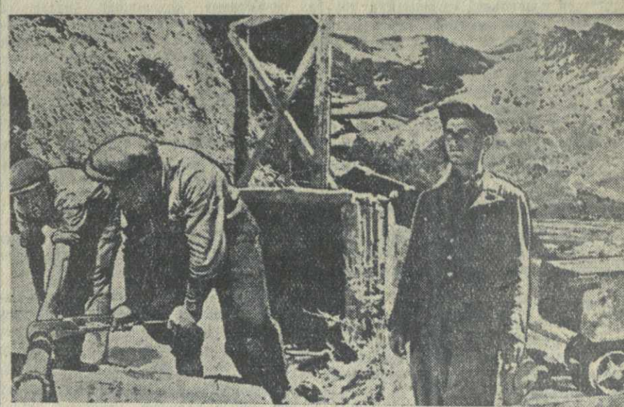
Несколько лет назад, у селения Квайси, на высоте до 2.000 метров над уровнем моря, началось сооружение переносной горной промышленности Юго-Осетии — Квайсиострой.

На месте, где раньше стояла глухая горная деревня, вырос рабочий поселок. Он пока еще не велик, но в нем уже построены дома для рабочих и специалистов, сложные из красивого местного туфа, водопровод, электростанция, столовая, пекарня, магазин, почта, больница, клуб. Телефон связывает стройку с областным центром.