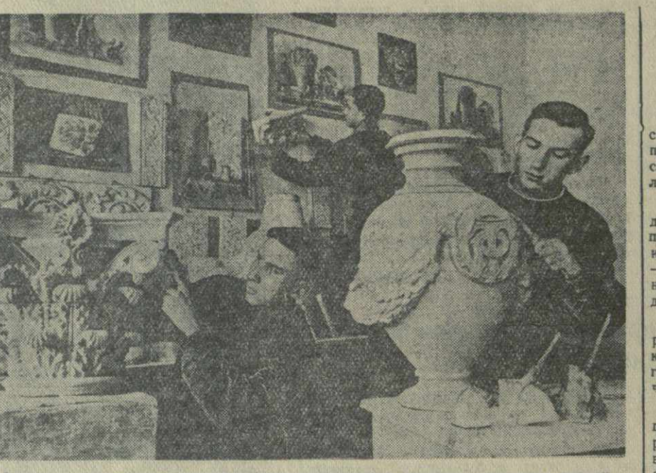
Вчера в тбилисском художественно-ремесленном училище состоялся выпуск. На снимке: занятия в классе лепки.