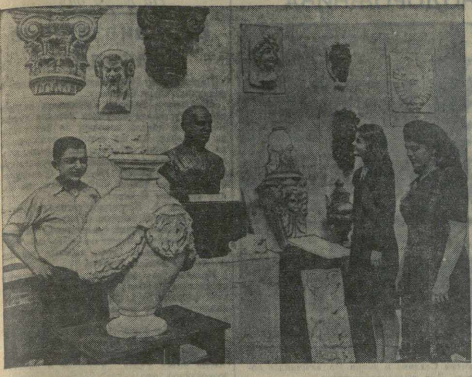
На выставке работ выпускников Тбилисского художественно-ремесленного училища.

Первый выпуск Тбилисского художественно-ремесленного училища