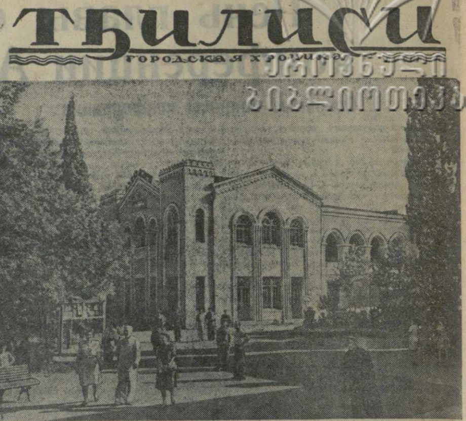
Кинотеатр «Гигант» в саду клуба имени Плеханова.

Министерство иностранных дел Болгарии сделало представление греческому правительству, выразив протест против новых провокаций, и потребовало немедленного возвращения раненого пограничника и привлечения виновных к ответственности.