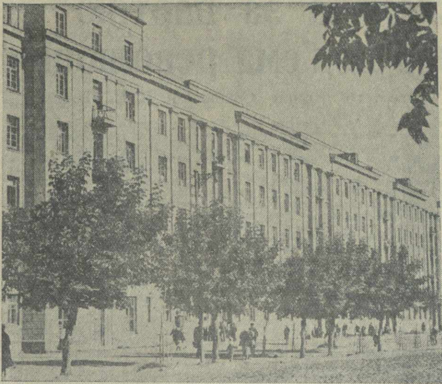
На снимке: восстановленные дома на Первомайской улице в г. Могилеве.

Около двух тысяч гектаров отводится под закладку питомников для выращивания различных пород деревьев. (ТАСС).