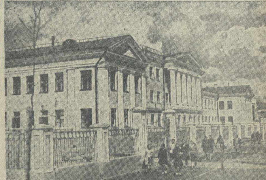
Горький. Машиностроительный завод имени Сталина построен для рабочих и служащих новой поликлоники. На снимке: общий вид поликлоники завода имени Сталина.

Широко показано на выставке искусство художественной росписи прославленных мастеров Палека и Истеры, костерские изделия хохломских и тобольских