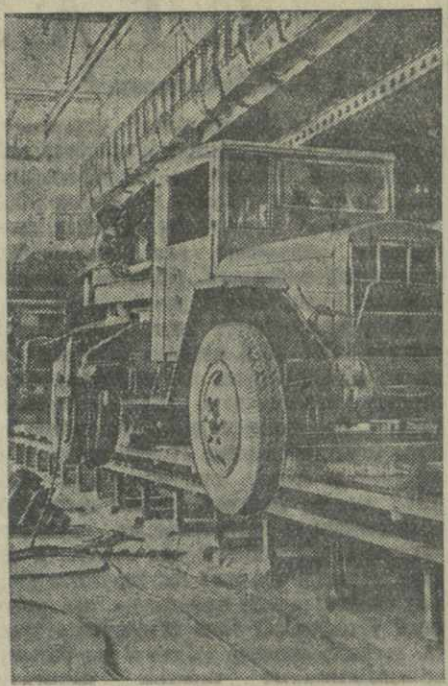
Дисперсионный завод. На автомобильном заводе освоена проектная мощность главного конвейера по производству автокранов «К-31». Выпуск продукции увеличен с начала года в два с половиной раза. На снимке: сборка автокранов на главном конвейере.