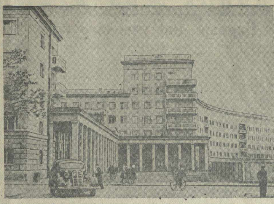
Жилой корпус Ленинградского электротехнического института инженеров связи и связи в Петроградской стороне.