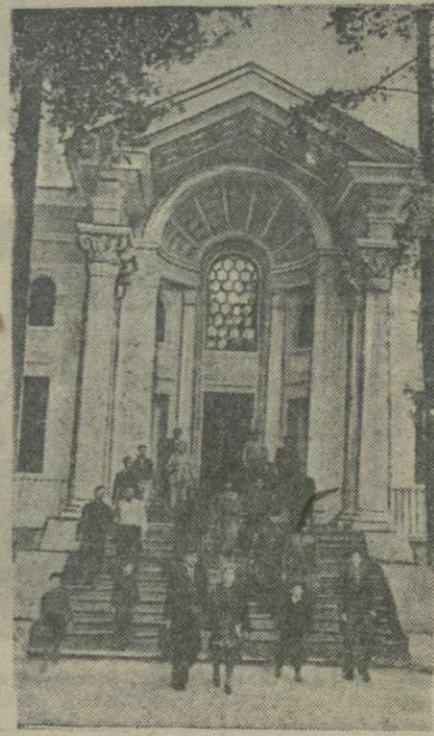
В дни празднования 30-й годовщины Октября в Сухуми был открыт новый театр Абхазской государственной филармонии. Здание театра — одно из лучших в городе. На снимке: вход в новый театр.

Музей предполагает в ближайшее время приступить в районе обнаруженной находки к контрольным раскопкам.