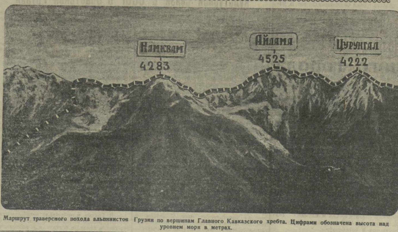
Маршрут траверсного похода альпинистов Грузии по вершинам Главного Кавказского хребта. Цифрами обозначена высота над уровнем моря в метрах.

После выхода штурмовой группы на хребет наблюдение за ней велось одновременно со стороны Корундани и Унгугуи. По выходе штурмовой группы на вершину Намквам ушугульская спасательная группа возвратилась в Корундани, откуда отчетливо просматривался весь дальнейший путь.