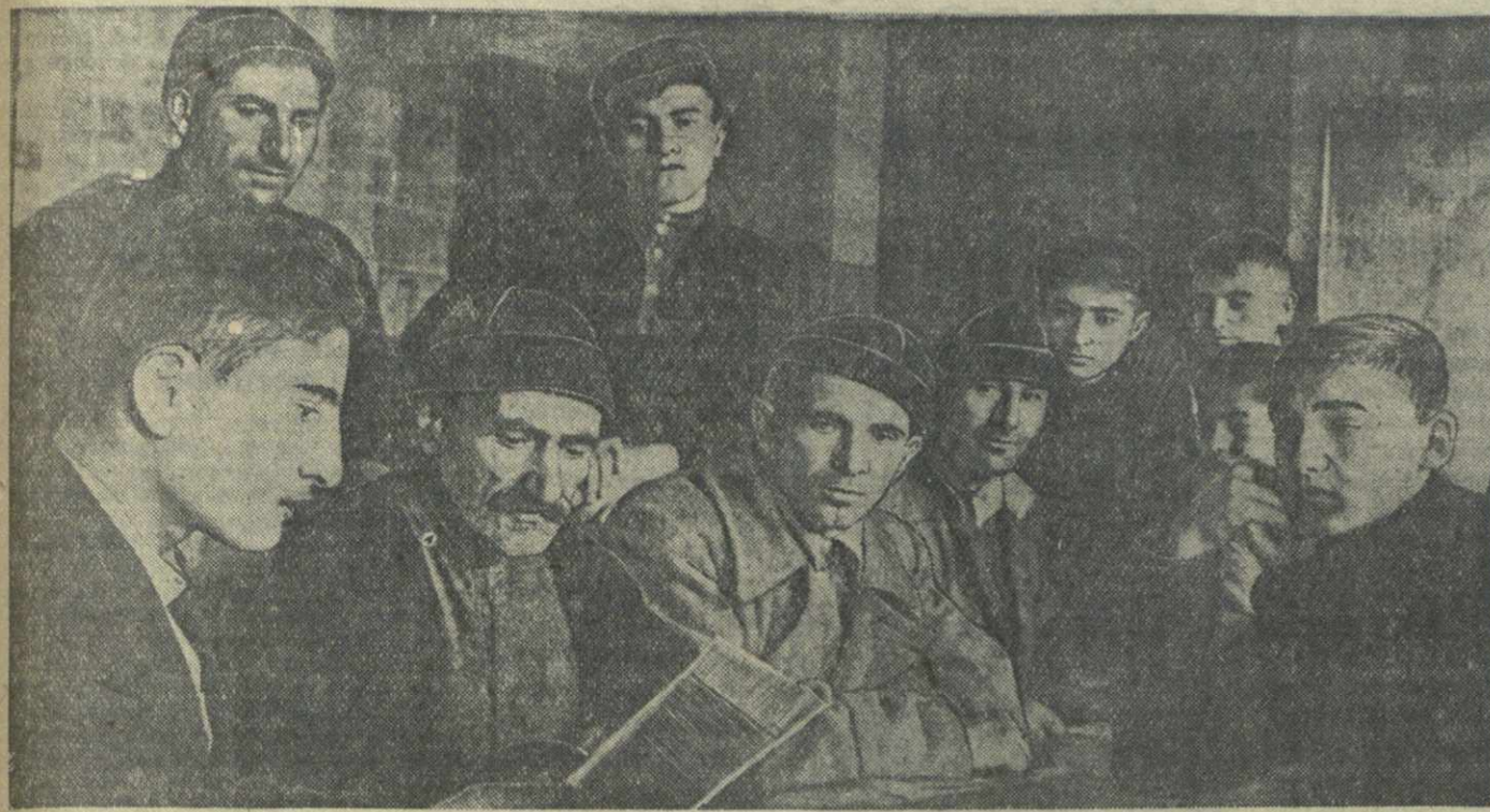
Труженицы Верхней Сванети изучают Положение о выборах в местные Советы. На снимке: беседа об избирательном законе в Доме культуры в Месте.