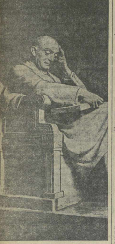
Захарий Палиашвили. Скульптура работы П. Тавадзе.