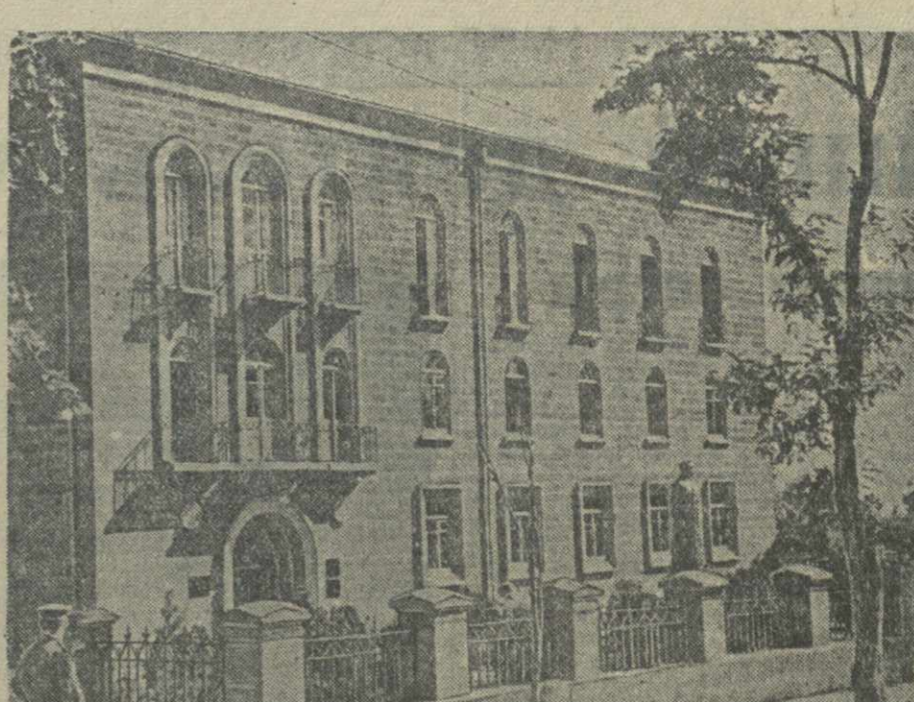
В Тетри-Цкаро закончено строительство большого трехэтажного здания. В нем разместятся районные организации, а также районный партийный кабинет, при котором оборудован большой лекционный зал.

Второй период длился с 17 по 26 ноября, когда Народно-освободительная армия вступила в юго-западную часть провинции Хюань. Народно-освободительные войска сорвали наступление 20-й гоминдановской дивизии в районе Фангчэна и изолировали гоминдановский военный и политический центр Наньян, находящийся южнее Лояна.