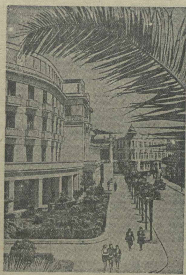
Сухуми. У здания гостиницы «Абхазия».

Сухум или Пхуми, как он назывался в старину, — один из древнейших городов Грузии. На протяжении своей многовековой истории Сухуми помнит немало завоевателей. Он героически отражал бесчисленные разбойничьи набеги иноземных захватчиков — римских императоров, турецких султанов, персидских шахов. В 1877 году, во время русско-турецкой войны, Сухуми был сожжен и разрушен турецкими войсками. После войны в нем оставалось две сотни жителей. Город при паризе восстанавливался и развивался очень медленно. Вот, что он представлял в то время: