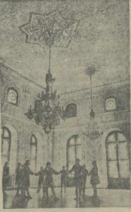
В зеркальном зале Дворца пионеров и октябрят.