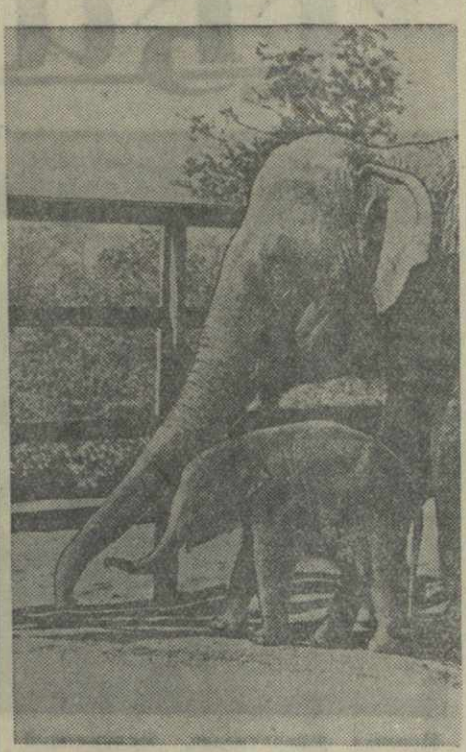
В Московском зоопарке появился на свет новый обитатель — слоненок. Мать его — слониха Молли, отец — знаменитый Шанго, в свое время выступавший в цирке. Рождение детеныша у слонов, находящихся в неволе, является очень редким случаем. Сейчас слоненку полтора месяца. Его рост достиг 125 сантиметров. Слониха Молли тщательно оберегает своего детеныша и не отступает его далеко от себя. На снимке: слониха Молли с детенышем.