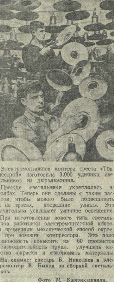
Электромонтажная контора треста «Тбилистэр» изготовила 3.000 уличных светильников из дюралюминия.