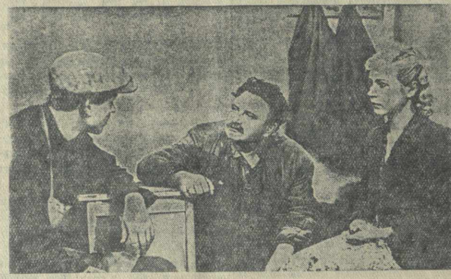
Кадр из фильма «Молодая гвардия».