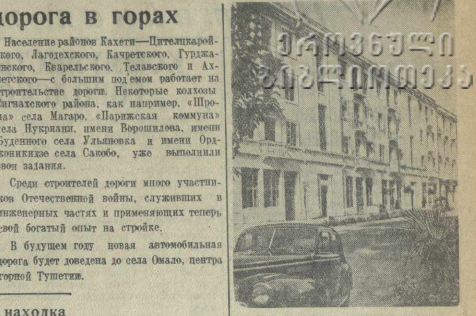
Жилой дом по улице Сталина в г. Махарадзе.

В первом этаже здания открывается большой гастрономический магазин. Новый дом—одно из красивейших зданий города.