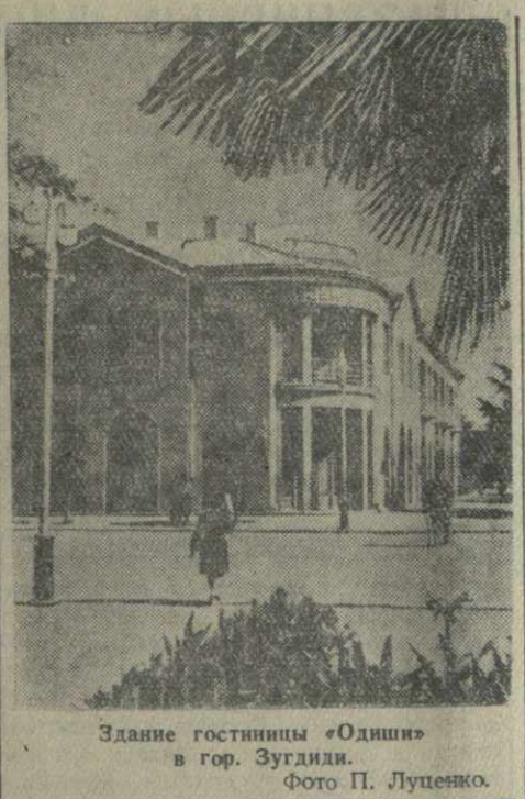
Здание гостиницы «Один» в г. Зугдиди.

Следующий номер «Зари Востока» выйдет 13 ноября.