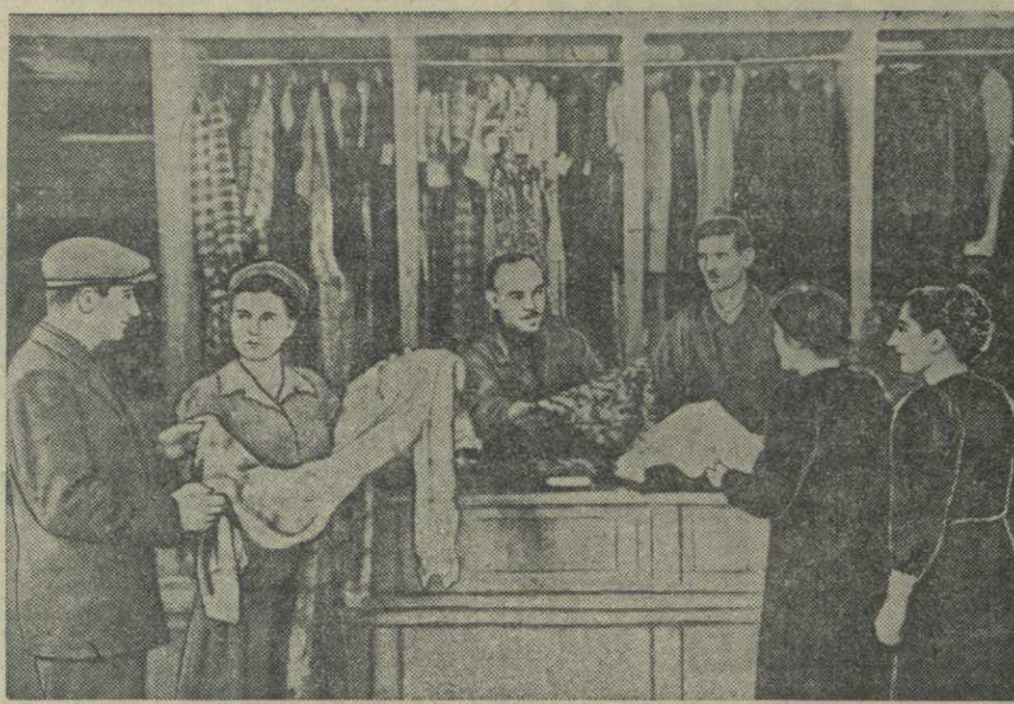
В первом этаже нового большого жилого дома на углу Плехановского проспекта и улицы Марджанишвили Тбилисстрой закончил оборудование магазинов во всех помещениях, отведенных под торговые предприятия.

Вслед за продовольственными магазинами Коопторга и Тбилисцторга и цветочным магазином Горелестрой здесь открыты большой магазин № 4 Тбилисторга с отделами трикотажно-галanterейным, текстильным, швейным и парфюмерных товаров, магазин Главбумбаста и Боржинвода, аптека и парикмахерская.