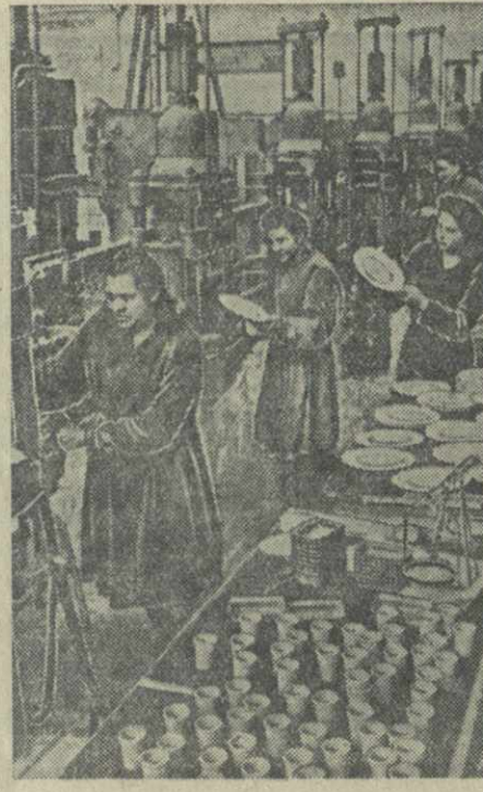
Тбилисский завод пластмасс. На снимке: в прессовом цехе завода.

Среди многообразных форм активного участия масс во всенародном движении за сверхплановые накопления важное место занимает рационализация и изобретательство. Например, на Тбилисском паровом — вагонометном заводе при обработке некоторых деталей в стружку уходило больше металла, чем весила обрабатываемая деталь. При этом потерей следует считать не только металл, уходящий в стружку, но также и в сотни тонн перерасхода электроэнергии, износ инструментов и т. д.