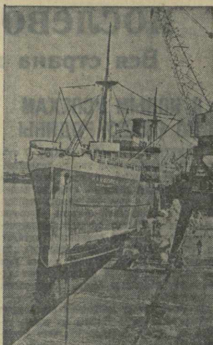
Среди экипажей судов Одесского порта, досрочно завершившего годовую план, ширится соревнование за увеличение скоростных грузоперевозок. Недавно к причалу торгового флота «Николаев», доставивший промышленные грузы, экипаж корабля добился хороших производственных показателей. Команда своими силами провела профилактический ремонт и увеличила ходовую скорость на 0,5 мили в час, сэкономила 400 тонн горючего. На снимке: паролод «Николаев» в порту под разгрузкой.