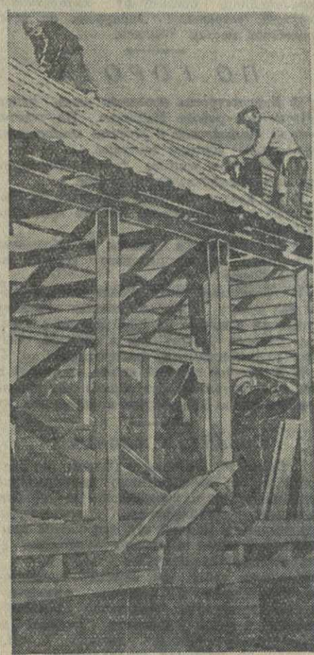
Высокий урожай кукурузы выращен в этом году колхозниками колхоза имени Сталина. Для хранения зерна колхоз строит в поле большие зернохранилища емкостью около 20 тысяч пудов. На снимке: стройка зернохранилища.

председатель колхоза имени газеты «Коммунист» селения Дарчли Зугдидского района.