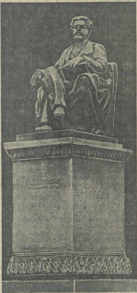
Лауреат Сталинской премии заслуженный деятель искусств К. Мерабишвили закончил проект памятника выдающемуся грузинскому физиологу И. Тархнишвили. Фигура ученого будет отлита из бронзы, постамент — высечен из гранита. Памятник устанавливается перед зданием Медицинского института в Тбилиси. На снимке: проект памятника.