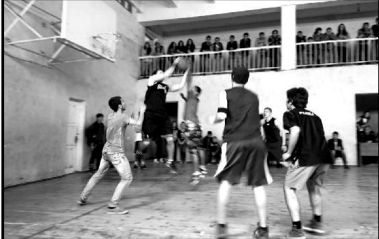
საჩუქრებით დააჯილდოვეს. I ადგილი: შპს "ბესიკ ნიპარიშვილი" მრავალპროფილიანი სკოლა-გიმნაზია. ორე საჯარო სკოლა. კასპის მუნიციპალიტეტის სპორტის დაწესებულებების გაერთიანება

გარდამავალი თასი გადასცეს, ხოლო საუკეთესო მოთამაშეები სიგელებითა და ფასიანი II ადგილი: სოფელ ქვემო ჭალის საჯარო სკოლა. III ადგილი: კასპის მე-