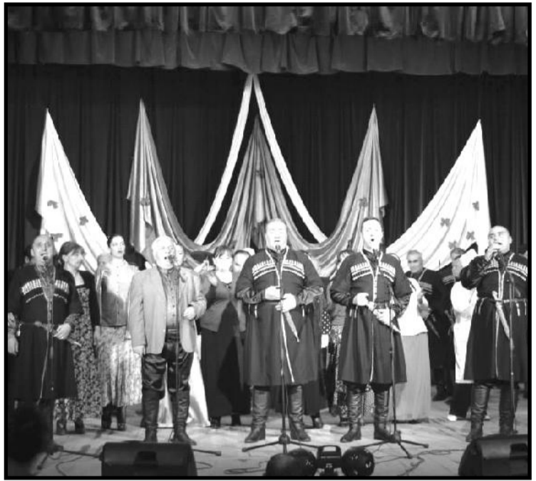
ეს შემოქმედებითი ურთიერთობა კულტურის დაწესებულებების გაერთიანებასა და სამომავლოდ გაგრძელდება.