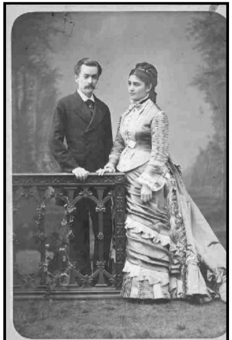
თებრო ნარიშკინა ქვრივი

1859 წლის ახალ წელს ალექსანდრე დიუმა, თბილისის მაღალ საზოგადოებასთან ერთად, მეფისნაცვალ ალექსანდრე ივანეს ძე ბარიატინსკის კარზე შეხვდა.