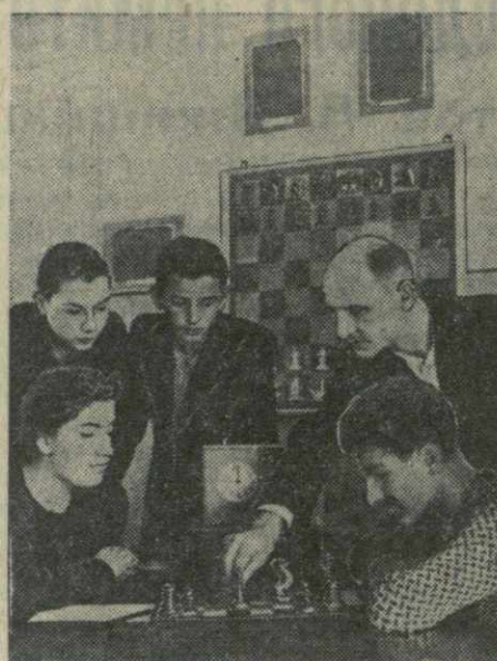
В шахматном кабинете Дворца пионеров и школьников имени Л. П. Берия было особенно оживленно в дни каникул. Юные шахматисты проводили здесь долгие часы за изучением шахматной теории, тренировкой, участвовали в турнирах.

За последние годы кабинетом подготовлено много одаренных шахматистов. 14 из них уже имеют вторую всесоюзную категорию.