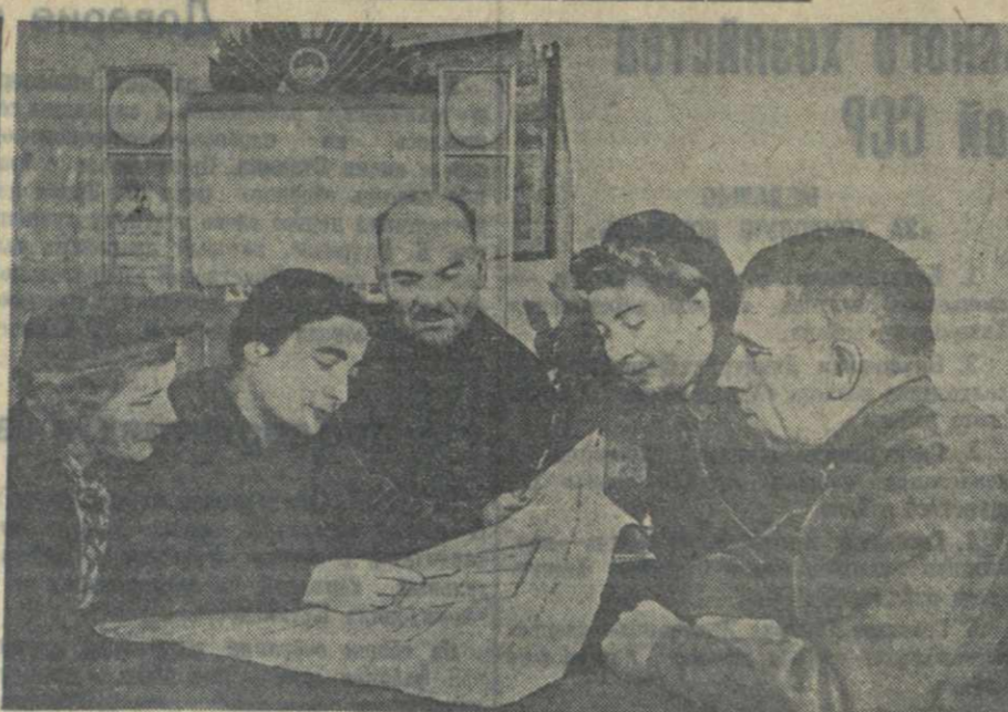
В Сухуми образованы избирательные участки по выборам в Верховный Совет СССР. На снимке: группа агитаторов знакомится с границами Гоголевского избирательного участка.

К агитационной работе в эти дни привлекается весь партийный и советский актив района. Пропагандисты и агитаторы систематически проводят беседы в горных селах.