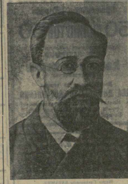
«Величие и красоту жизни составляет одна только свобода; только свобода может обогатить и возвысить человечество», — эти слова, предсказанные одной из статей журнала, являлись боевым девизом его сотрудников.