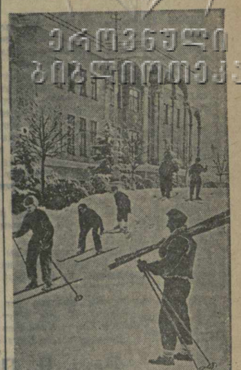
Лыжники на верхнем плато фуникулера.