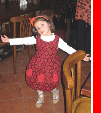
მეგობრებო, მადგანოთ თქვენი ილომის, შვილიშვილების დაბადობის დღესასწაულს აღსანიშნავად დაგეგმილად გვსურს...