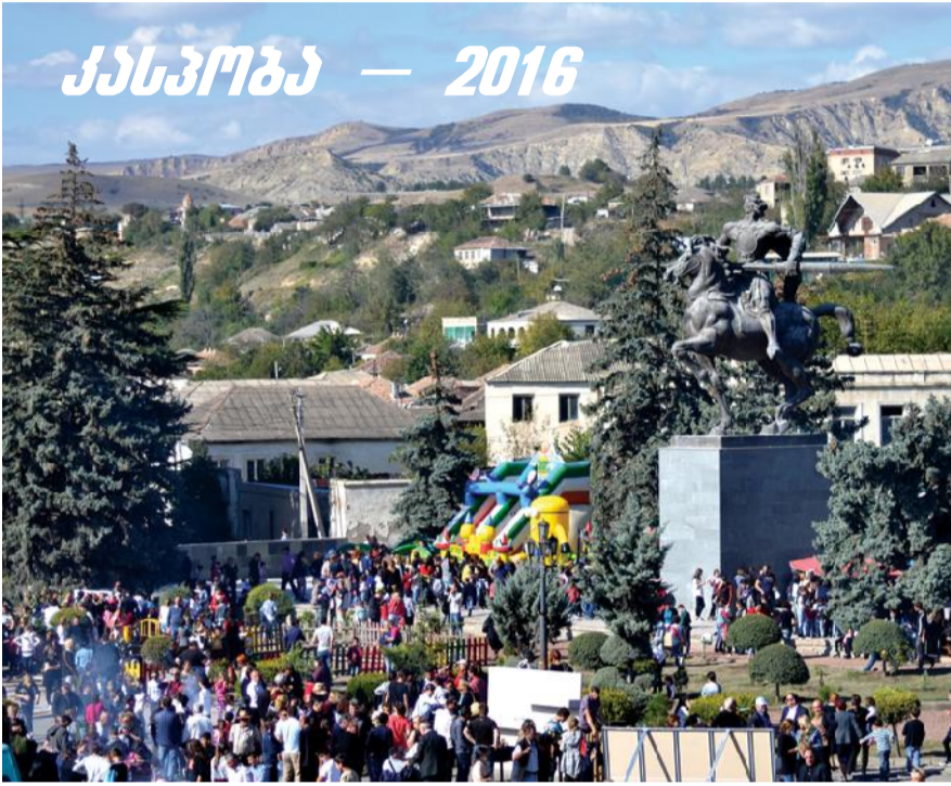
კასპოპა — 2016