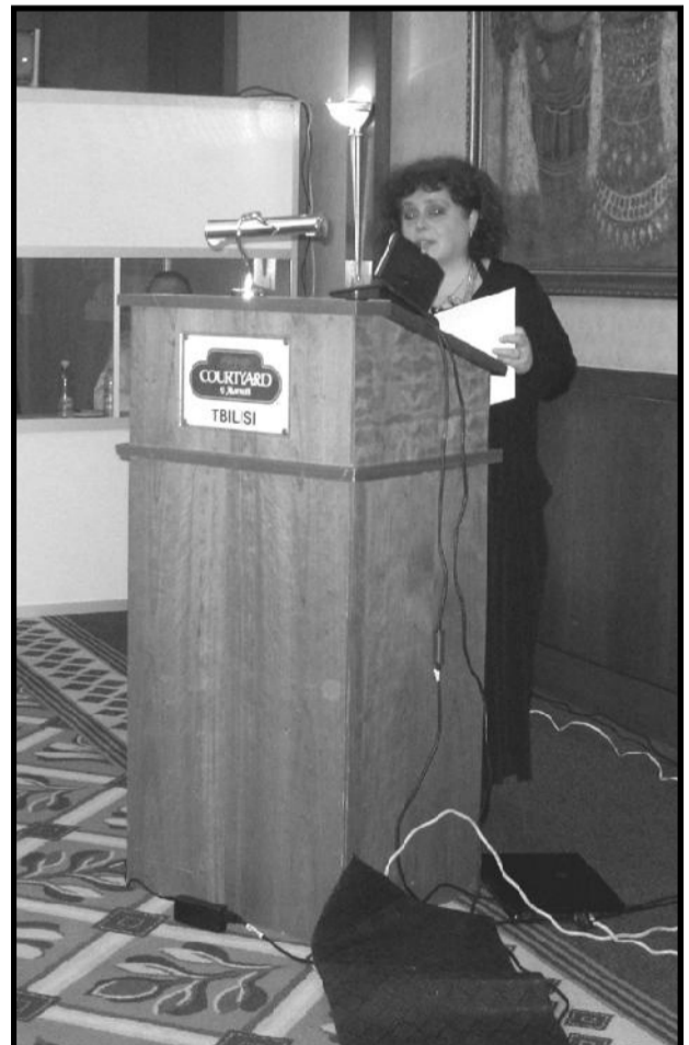
2011 წელი. მარტო. სასტუმრო “ქორთიარდ მარტო”. გაზეთი “ანალი განთიადი” დაჯილდოვდა ღვენილი მონასტროვის პრემიისთვის და მხონარაბის გაზეთისთვის გამომცემის აქტიურობისა და მხარდაჭერისათვის.