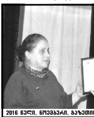
2016 წელი. ნოაბაბი. გაზეთის გამომცემის 85 წელი შეასრულდა

ერთხელ, რაიკომში, კონფლიქტური სიტუაცია ირჩეოდა, აი ისეთი, ადამიანური და საზოგადო კანონების ვექტორი რომ არ ემთხვევა ხოლმე ერთმანეთს; სიტუაციის ტრაგიზმი კი იმაში მდგომარეობდა, რომ მშიშარა და ნაკლებგანსწავლულმა (რბილად რომ ვთქვათ!) სხივი არ მოაკლონ “განთიადს”, რომელიც ყოველცისმარე ახალია. განახლება კი სიცოცხლის აუცილებელი პირობა გახლავთ.