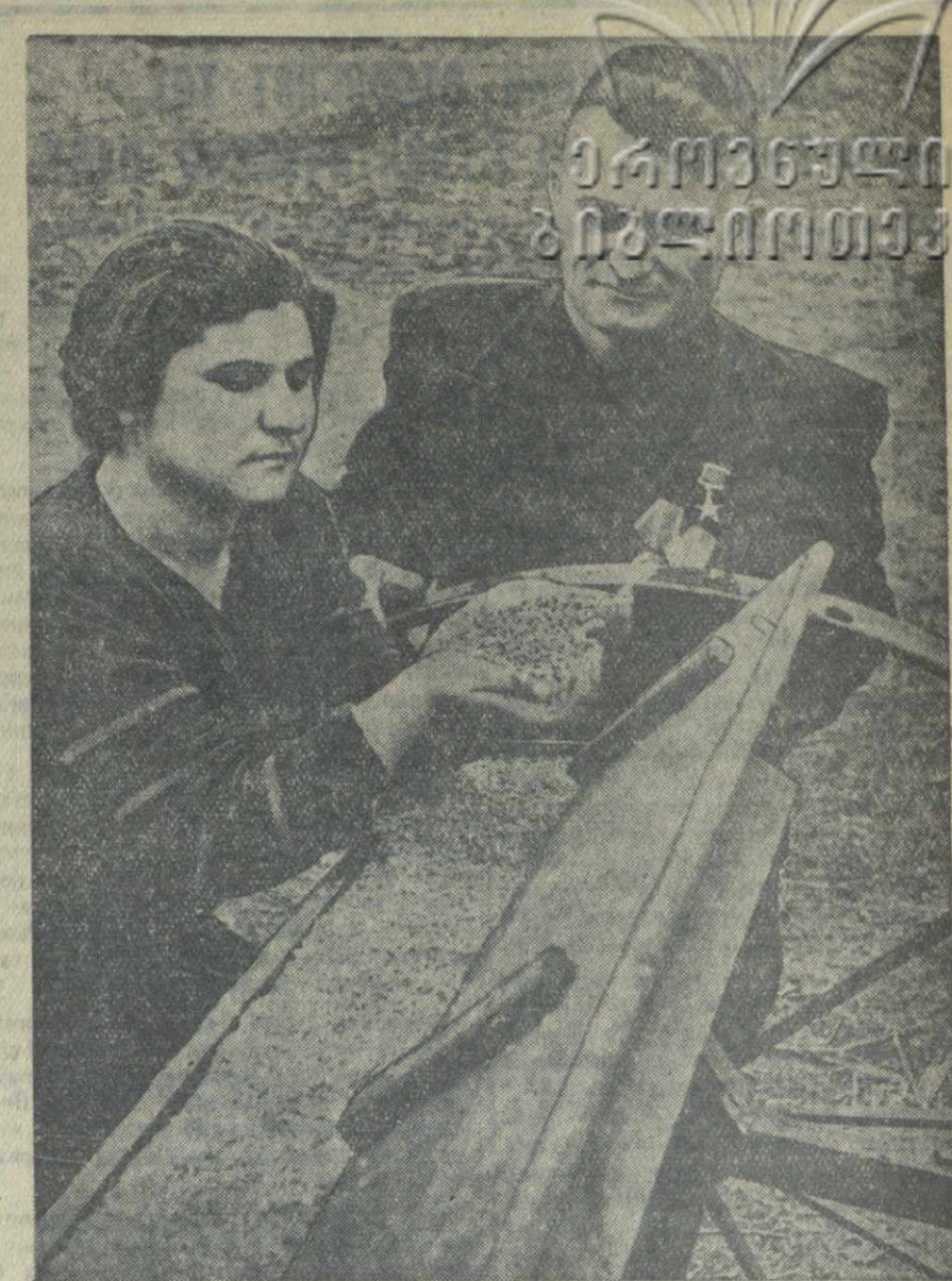
В КАХЕТИИ весна все полнее вступает в свои права. С каждым днем расширяется фронт полевых работ.

В ответ на решения XIV с'езда КП(б) Грузии колхозники обязались копать в этом году озимой пшеницы 25—30 центнеров с гектара на площади 120 гектаров, кукурузы — по 55 центнеров с 88 гектаров и по 65 центнеров с 90 гектаров.